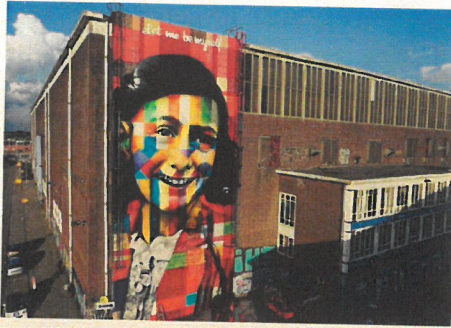
Een graffitikunstwerk van Anne Frank door straatkunstenaar Kobra.